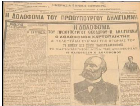
Πρωτοσέλιδο της εποχής

Ο Θεόδωρος Δηλιγιάννης κηδεύτηκε την επόμενη μέρα με μεγάλες τιμές. Η καρδιά του φυλάσσεται στο ναό των Αγίων Ταξιαρχών στη γενέτειρά του, Λαγκάδια, ενώ ανδριάντας του έχει στηθεί στην είσοδο της παλιάς Βουλής.