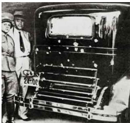
Το αυτοκίνητο του Βενιζέλου κατά την τέταρτη απόπειρα δολοφονίας