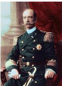
Η δολοφονία του βασιλιά Γεωργίου Α'

Τη νύχτα της 10 ης Απριλίου 1831 ο νεκρός Καποδίστριας μεταφέρθηκε με ένα ρωσικό πολεμικό στην Κέρκυρα για να ταφεί. Διάφορες μελέτες που έγιναν αργότερα υποστηρίζουν ότι η δολοφονία του Καποδίστρια οργανώθηκε από ξένες δυνάμεις και συγκεκριμένα από τη Γαλλία και τη Μεγάλη Βρετανία. Πιθανόν να θεωρούσαν ότι ο Καποδίστριας ήταν όργανο της Ρωσίας και ότι ένα ισχυρό κράτος στην Ανατολική Μεσόγειο (αυτό προσπαθούσε να δημιουργήσει ο Καποδίστριας), το οποίο δεν θα μπορούσαν να ελέγχουν, δεν θα βοηθούσε τα σχέδιά τους.