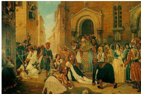
Η δολοφονία του Καποδίστρια

Οι δύο ακόλουθοι του Καποδίστρια τράβηξαν αμέσως τα πιστόλια τους και πυροβόλησαν. Η τρίτη σφαίρα που έριξε κατά των δολοφόνων ο Κρητικός μονόχειρας σωματοφύλακας του Καποδίστρια διαπέρασε τον θώρακα του Κωνσταντή. Παρ' όλη τη βαριά λαβωματιά, ο Κωνσταντής τράπηκε σε φυγή, ενώ πλήθος λαού τον κυνηγούσε. Όταν ο λαός τον έφθασε, τον βρήκε καταγής να πλέει στο αίμα. Ο Γιώργης Μαυρομιχάλης κατέφυγε στη γαλλική πρεσβεία και παραδόθηκε στις αρχές ύστερα από την επιμονή του πλήθους που είχε συγκεντρωθεί και απειλούσε να κάψει το κτίριο. Τελικά καταδικάστηκε σε θάνατο και τουφεκίστηκε λίγες μέρες αργότερα.