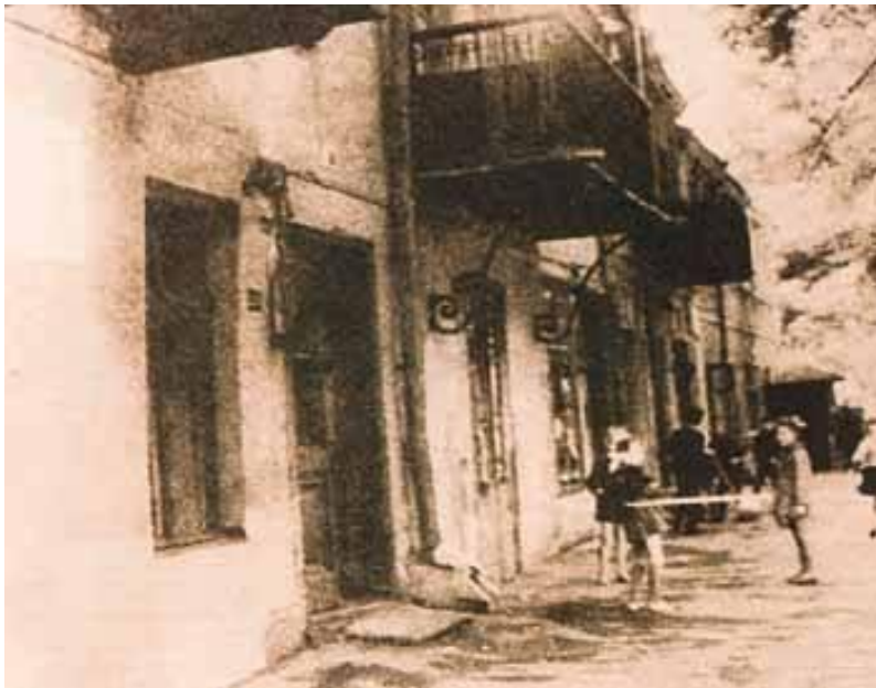
Το σπίτι στην Οδησό όπου ιδρύθηκε η Εταιρεία

Η Φιλική Εταιρεία ήταν μια μυστική, επαναστατική οργάνωση που ιδρύθηκε στις 14 Σεπτεμβρίου 1814 στην Οδησό της Ρωσίας, το σπουδαιότερο εμπορικό κέντρο της Νότιας Ρωσίας. Πρωτεργάτες της ήταν ο Νικόλαος Σκουφάς, ο Αθανάσιος Τσακάλωφ και ο Εμμανουήλ Ξάνθος. Ήταν και οι τρεις έμποροι που ζούσαν έξω από την Ελλάδα, αλλά πονούσαν για την άθλια κατάσταση στην οποία είχε περιπέσει η πατρίδα τους την εποχή της σκλαβιάς. Τέταρτο μέλος της μυήθηκε ο Αντώνιος Κομιζόπουλος, ενώ από τα πρώτα μέλη που μυήθηκαν ήταν και ο Παναγιώτης Αναγνωστόπουλος, ο οποίος κατά ορισμένες πηγές ήταν συνιδρυτής.