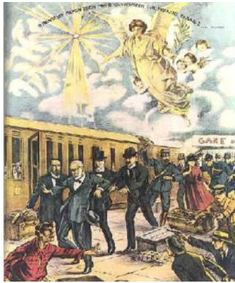
Η απόπειρα δολοφονίας κατά του Βενιζέλου στο Παρίσι

Στις 6 Ιουνίου 1933 ο Ελευθέριος Βενιζέλος δέχτηκε την τελευταία απόπειρα δολοφονίας. Εκείνο το βράδυ μαζί με τη σύζυγό του Έλενα γευμάτιζαν στο σπίτι της Πηνελόπης Δέλτα στην Κηφισιά. Εκείνες τις μέρες ακούγονταν συνεχώς φήμες ότι προετοιμαζόταν η δολοφονία του Βενιζέλου. Μάλιστα, όπως αναφέρει η Π. Δέλτα στα Ημερολόγιά της, συζήτησαν το θέμα αυτό και εκείνο το βράδυ. Ο ίδιος ο Βενιζέλος ψυχραιμότατος απαντούσε: «Αυτοί είναι οι κίνδυνοι του επαγγέλματος» και γελούσε αδιάφορος. Το ζευγάρι παρέμεινε εκεί ως τις 11 το βράδυ, οπότε πήραν το δρόμο της επιστροφής για την Αθήνα. Το ζεύγος Βενιζέλου επέβαινε σε ένα αυτοκίνητο «Πακάρ», ενώ ακολουθούσε ένα «Φορντ» με τους άνδρες ασφαλείας. Ξαφνικά ένα αυτοκίνητο με σβησμένα τα φώτα έκλεισε το δρόμο του αυτοκινήτου ασφαλείας του Βενιζέλου και ακούστηκαν πυροβολισμοί. Ένας από τους σωματοφύλακες χτυπήθηκε στο κεφάλι και πέθανε λίγο αργότερα. Αμέσως ξεκίνησαν οι πυροβολισμοί και κατά του αυτοκινήτου του Βενιζέλου. Έπεσαν γρήγορα να κρυφτούν και ο οδηγός πάτησε το γκάζι. Το κυνηγητό μαζί με πολλούς πυροβολισμούς κράτησε περίπου μισή ώρα, ώσπου το αυτοκίνητο του Βενιζέλου κατόρθωσε να ξεφύγει. Αμέσως πήγαν στο νοσοκομείο, καθώς η Έλενα Βενιζέλου είχε τραυματιστεί.