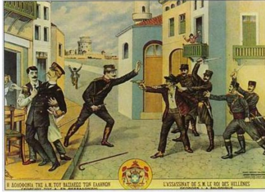
Η δολοφονία του Γεωργίου Α΄

Φραγκούδη, αλλά αυτός πρόλαβε να τον αφοπλίσει και να τον παραδώσει σε δύο Κρητικούς χωροφύλακες, που είχαν προστρέξει στο σημείο της δολοφονίας. Ο Γεώργιος μεταφέρθηκε στο ιατρείο του «Παπάφειου Ιδρύματος», αλλά οι γιατροί δεν μπόρεσαν να προσφέρουν καμιά βοήθεια, καθώς ήταν ήδη νεκρός.