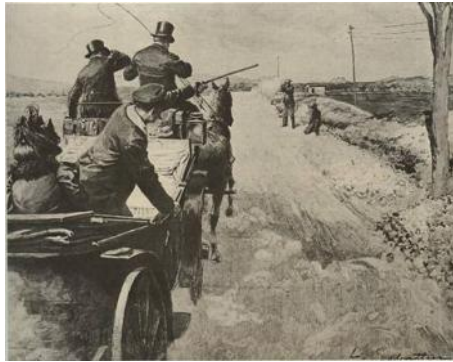
Η απόπειρα δολοφονίας του Γεωργίου

Ελλάδας στον ελληνοτουρκικό πόλεμο του 1897 (ένα χρόνο πριν) φαίνεται να είναι η αιτία της αποτυχημένης δολοφονικής απόπειρας, καθώς η ελληνική κοινωνία είχε δυσανεχθεί πολύ και έψαχνε τους υπαίτιους της ταπείνωσης.