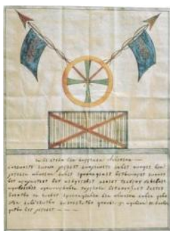
Το έμβλημα της Φιλικής Εταιρείας

συνθηματικό αρχικό του μέλους στο οποίο προοριζόταν η οδηγία. Όλα τα μέλη της Φιλικής Εταιρείας ήταν υποχρεωμένα να εκτελούν χωρίς αντίρρηση τις διαταγές της λεγόμενης «Αόρατης Ανώτατης Αρχής». Γνώριζαν καλά, άλλωστε, πως εκείνος που θα δοκίμαζε να αποκαλύψει το μυστικό θα έβαζε σε κίνδυνο τη ζωή του, αφού στην ιστορία της Φιλικής Εταιρείας έχουμε και περιπτώσεις που οι προδότες τιμωρήθηκαν με θάνατο. Αρκετοί βέβαια ήταν αυτοί που πίστευαν ότι πίσω από την Αόρατη Αρχή κρυβόταν ο Ιωάννης Καποδίστριας ή ακόμη και ο ίδιος ο τσάρος. Στην πραγματικότητα οι πρωτεργάτες της Εταιρείας είχαν όντως απευθυνθεί στον Ιωάννη Καποδίστρια, που ήταν τότε υπουργός εξωτερικών της Ρωσίας. Όμως εκείνος, επειδή γνώριζε την εχθρική διάθεση των ευρωπαϊκών δυνάμεων απέναντι στα επαναστατικά κινήματα, αρνήθηκε. Στη συνέχεια, απευθύνθηκαν στον Αλέξανδρο Υψηλάντη, ο οποίος δέχτηκε με ενθουσιασμό κι έγινε ο γενικός αρχηγός της Φιλικής Εταιρείας.