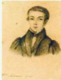
Ο Δ. Σολωμός σε νεώτερη ηλικία