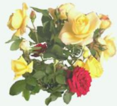
Διονύσιος Σολωμός Οι Ελεύθεροι Πολιορκημένοι (σχεδιάσμα β').

Λευκό βουνάκι πρόβατα κινούμενο βελάζει, Και μες στη θάλασσα βαθιά ξαναπετιέται πάλι, Κί' ολόλευκο εσύμιξε με τ' ουρανού τα κάλλη, Και μες στις λίμνης τα νερά, σπ' έφθασε μ' ασπούδα, Έπαιξε με τον ίσκιο της γαλάζια πεταλούδα, Που ευώδιασε τον ύπνο της μέσα στον άγριο κρίνο' Το σκουληκάκι βρίσκεται σ' ώρα γλυκιά κί' εκείνο, Μάγεμα η φύσις κί' όνειρο στην ομορφιά και χάρη, Η μαύρη πέτρα ολόχρυση και το ξερό χορτάρι' Με χίλιες βρύσες χύνεται, με χίλιες γλώσσες κραίνει' Όποιος πεθάνη σήμερα χίλιες φορές πεθαίνει.