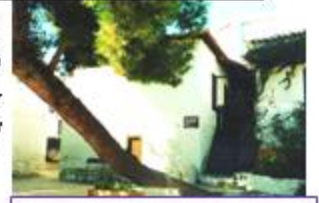
Οικία (Μενεζέ) Παπαδιαμάντη