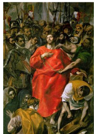
ΔΟΜΙΝΙΚΟΣ ΘΕΟΤΟΠΟΥΛΟΣ ΔΙΑΜΕΛΙΣΜΟΣ ΙΜΑΤΙΩΝ

Θεριά οι ανθρώποι δεν μπορούν το φως να το σηκώσουν δεν είναι η αλήθεια πιο χρυσή απ' την αλήθεια της σιωπής χίλιες φορές να γεννηθείς τόσες, τόσες θα σε σταυρώσουν.