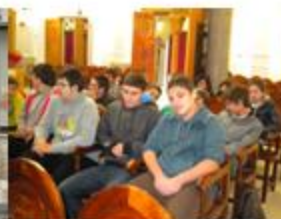
Οι μαθητές της γ' γυμνασίου στον Ι.Ν. του Αγίου Ιωάννη