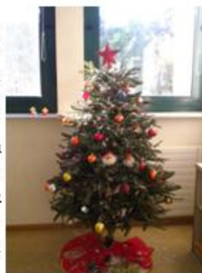
Χριστουγεννιάτικο δέντρο από στολισμό τάξης

Ομολογώ πως έκανα αυτές τις σκέψεις χωρίς να έχω μπροστά μου τα σημερινά παιδιά. Αυτά δεν έχουν ακόμα αντληφθεί την κρίση που δημιούργησαν οι χούντες των συμφερόντων και της ιδιοτέλειας. Εξάλλου και οι μαθητές του 1970 κατάλαβαν μετά από δυο – τρία χρόνια τι συνέβαινε τότε.