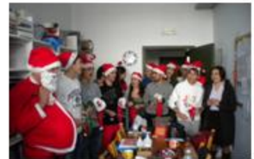
Στο γραφείο των καθηγητών

Την Τετάρτη 22/12 μας επισκέφθηκαν τα παιδιά της Γ' Λυκείου, για να μας ευχηθούν τα Χρόνια Πολλά και να πουν τα κάλαντα, τόσο στους καθηγητές του Γυμνασίου, όσο και στους μαθητές.