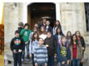
Οι μαθητές του α2 έξω από τον Ι.Ν. του Αγίου Τίτου

Τρίτη 14-12-2010 το α2 στον Ι.Ν. Αγίου Τίτου