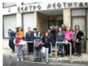
Οι μαθητές του α1 έξω από το κέντρο νεότητας του Αγ. Τίτου περιμένοντας το σχολικό

Ακολουθώντας και φέτος την παράδοση που θέλει τους μαθητές του Γυμνασίου να εκκλησιάζονται κάθε χρόνο πριν τις διακοπές των Χριστουγέννων, προγραμματίστηκαν εκκλησιασμοί ανά τμήματα.