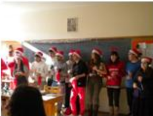
Λέγοντας τα κάλαντα στους μαθητές

Την Τετάρτη 22/12 μας επισκέφθηκαν τα παιδιά της Γ' Λυκείου, για να μας ευχηθούν τα Χρόνια Πολλά και να πουν τα κάλαντα, τόσο στους καθηγητές του Γυμνασίου, όσο και στους μαθητές.