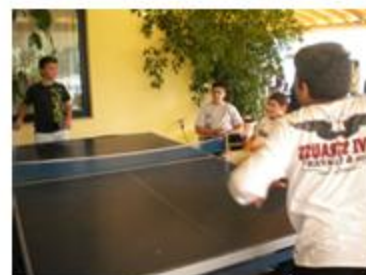
Παίζοντας Πινγκ- Πονγκ