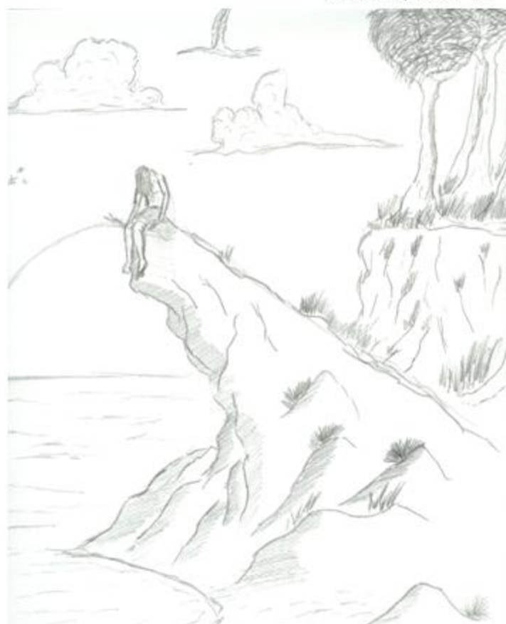
Ο Οδυσσέας στην Ωγυγία

Η τεράστια θλίψη του Οδυσσέα έρχεται σε αντίθεση με το όμορφο φυσικό περιβάλλον. Η πραγματική ευτυχία πηγάζει από την ψυχική ικανοποίηση.