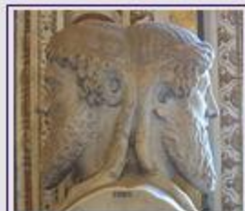
Απεικόνιση του Ιανού με τα δύο πρόσωπα (Μουσείο Βατικανού)

Ο Ιανός ξεκίνησε (κατά μία παράδοση) από τη γη της Θεσσαλίας και κατέληξε στο Λάτιο, για να γίνει βασιλιάς των Ρωμαίων αρχικά και αργότερα, μετά θάνατον, ένας από τους θεούς τους. Ως βασιλιάς ήταν δίκαιος και κολός και απέκτησε πολλά παιδιά. Ένα απ' αυτά ήταν και ο Τίβερης. Ως θεός ήταν ο θεός της αρχής, της κάθε αρχής. Όπου