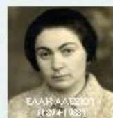
ΕΛΛΗ ΑΛΕΞΙΟΥ (1874-1952)

Τριάντα τώρα χρόνια από την έκδοσή του, το "Παρθεναγωγείον" - συνδυασμός θέματος και λογοτεχνικής ποιότητας- παραμένει ένα έργο κλασικό