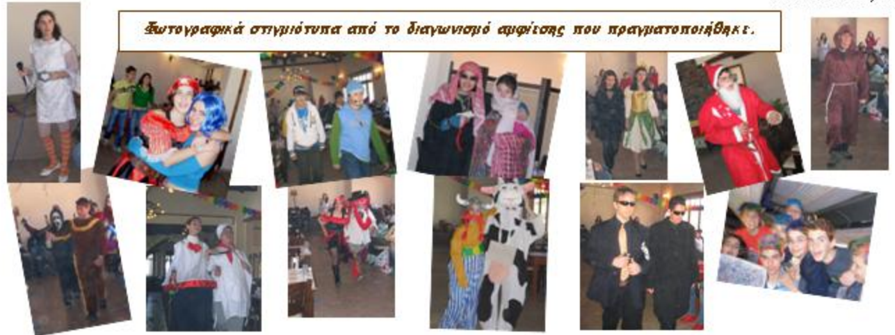
Φωτογραφικά στιγμιότυπα από το διαγωνισμό αμφίεσης που πραγματοποιήθηκε.