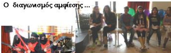
Η κριτική επιτροπή