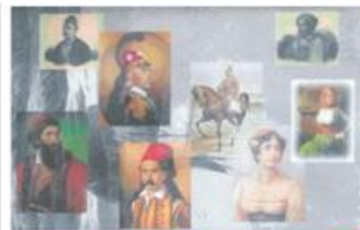
ΕΚΔΗΛΩΣΗ «ΤΟ ΠΑΤΡΙΩΤΗΣ» - Β1 ΓΥΜΝΑΣΙΟ - 2007-2008