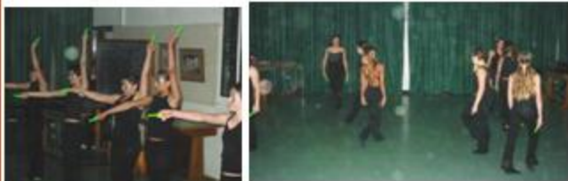
Εκδηλώσεις του Α2. (Με πρωτοβουλία των παιδιών).