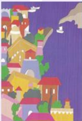
«Μουσικογραφίες» του Οδυσσέα Ελύτη που έγιναν με ο υποκείμενο και άσφαινη γορπά. Από το βιβλίο του ΣΑΠΦΩ, εκδόσεις ΤΚΑΡΟΣ.

Πολλοί στην ποίηση, επειδή τυχαίνει να 'ναι άσχημοι, διακηρύσσουν ότι ο Θεός έπλασε άσχημα τον κόσμο. Μερικοί φτάνουν και πιο πέρα: επειδή κινδύνεψαν κάποτε να πνιγούν, επιμένουν ότι η θάλασσα δεν είναι γαλάζια.