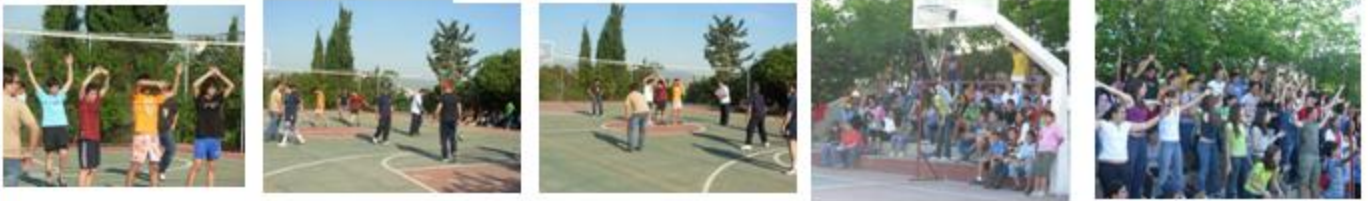
Αγώνας βόλεϊ καθηγητών-μαθητών.

Το παιχνίδι έληξε με 1-1 σετ, κατοχυρώθηκε, όμως, υπέρ των μαθητών, μια και είχαν καλύτερη διαφορά στους πόντους.