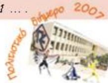
... και ο αποχαιρετισμός της γ' γυμνασίου

Από τα έργα που εκτίθενται στο διάδρομο του σχολείου.