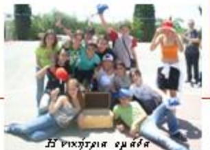
Η νικήτρια ομάδα