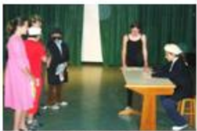
«Ο μικρός δυνάστης» του Δ. Ψαθά.