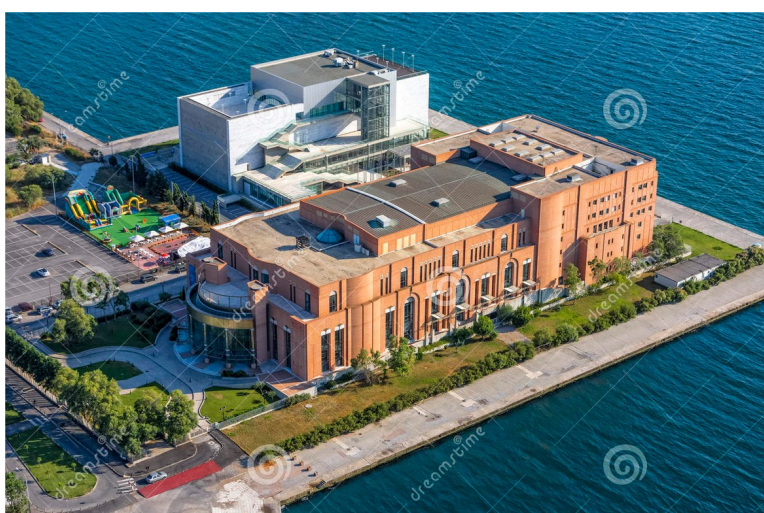
Μέγαρο Μουσικής Θεσσαλονίκης