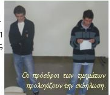
Οι πρόεδροι των τμημάτων προλογίζουν την εκδήλωση.