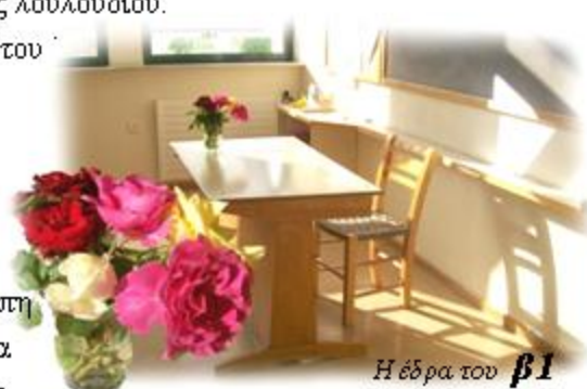
Η έδρα του β1 φροντισμένη από την Ειρήνη Δερματζακη

Από τη συλλογή Η ΦΙΛΟΣΟΦΙΑ ΤΩΝ ΛΟΥΛΟΥΔΙΩΝ