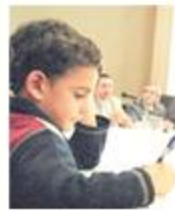
Μαθητής γράφει με στυλό. Η τέχνη της ιδιόχειρης γραφής μάς διδάσκει να ελέγχουμε το χέρι μας και ενισχύει τον συντονισμό χεριού και ματιού.

Η κρίση ξεκίνησε μετά τον πόλεμο, με την έλευση του στυλό διαρκείας. Τα πρώτα στυλό προκαλούσαν και αυτά πολλούς λεκέδες και αν, αμέσως αφού γράφατε, περνούσατε το δάχτυλο επάνω από τις τελευταίες λέξεις, σίγουρα θα γινόταν μουτζούρα. Έτσι χάθηκε η επιθυμία τού να γράφει κανείς καλά. Σε κάθε περίπτωση, ακόμη και όταν ήταν καθαρό, το γράψιμο με το στυλό δεν είχε πια ψυχή, στυλ και προσωπικότητα.